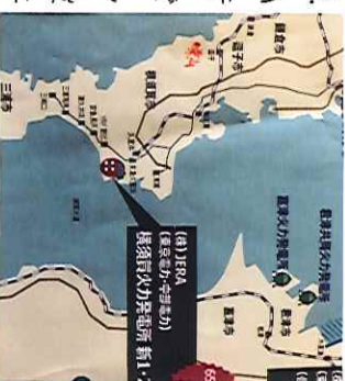
石炭火力発電所建設予定地

2017年「パリ協定」が発足し、多くの国が石炭火力発電所から撤退し「脱炭素社会」を目指しています。そんな中、いま新たに横須賀石炭火力発電所建設(65万KW×2基)が進められ、稼働すればCO2が年間726万トン、PM2.5等大気汚染物質を排出します。新建設なのに停止していた火力発電所の更新と位置付けられ、環境負荷の比較は行われず、また、住民説明も不十分なまま解体工事は進んでいます。学習会では環境問題だけでなく「再生可能エネルギー施設を」「石炭税が上げれば経営は成り立たず、建設事業者が儲けるだけ」など様々な意見が出されました。千葉県蘇我石炭火力計画は、昨年末、建設中止となりました。