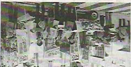
国税庁の発表によると、2019年度の消費税増税による増収額は約10兆円と見込まれている。